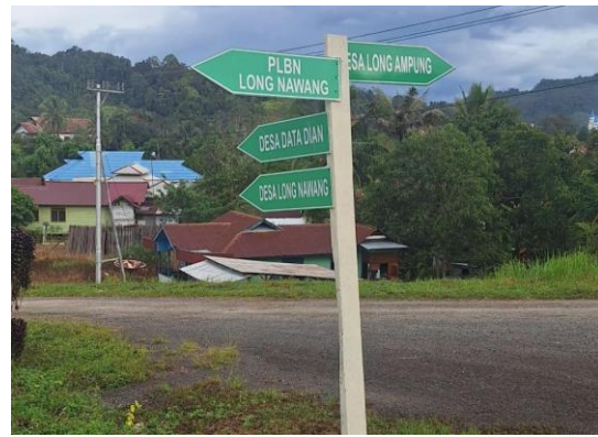
Figure 2. Infrastruktur Jalan dan Sarana Transportasi Desa Long Nawang