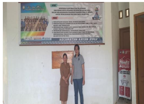
Figure 1. Kondisi Wilayah Desa Long Nawang sebagai Kawasan Perbatasan