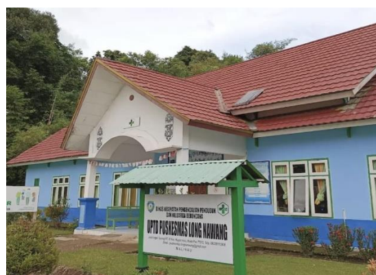
Figure 3. Fasilitas Pendidikan dan Kesehatan Desa Long Nawang